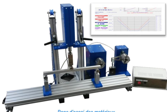
Banc d'essai des matériaux configuration flexion

Thématiques abordées Mécanique, Résistance des matériaux