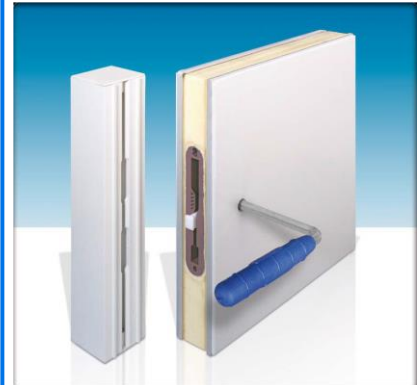
Principe de montage de la chambre froide