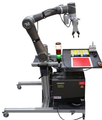
ON00: Station Cobot & Vision « Omron TM5 » avec châssis réglable en hauteur et plateau amovible