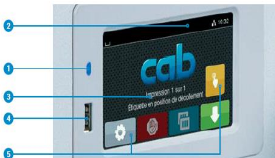
Imprimante tournée de 90°