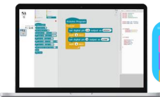
Logiciel de programmation mBlock 5