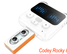
Codey Rocky & Neuron voir page C3