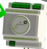
Module DIN triphasé