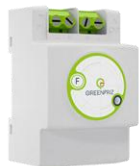
Module DIN monophasé