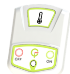
Sonde de température et bouton poussoir (régulation température/dérogation manuelle)