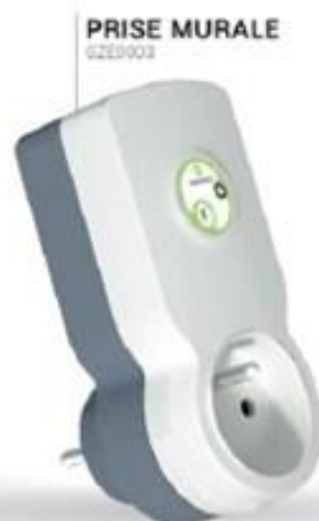
PRISE MURALE GZE0003