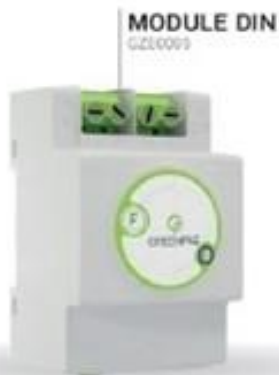
MODULE DIN GZE0009

Réalisez jusqu'à 43% D'ÉCONOMIES D'ÉLECTRICITÉ