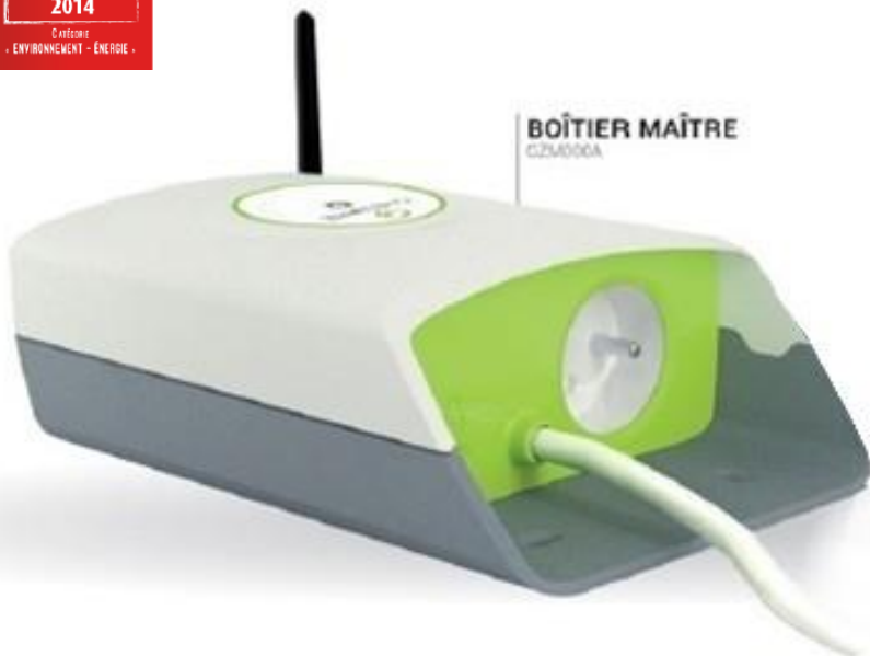
BOÎTIER MAÎTRE GZM000A

ADAPTÉE À TOUTS VOS BESOINS ET MATÉRIELS