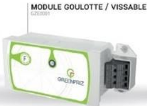
MODULE GOULOTTE / VISSABLE GZE0001