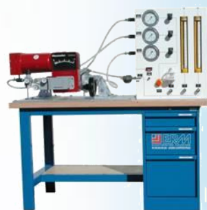
Banc de maintenance et test d'étanchéité de vannes de régulation industrielle

➤ Maintivannes : Système mécanique robuste pour le montage / démontage & test de bon fonctionnement