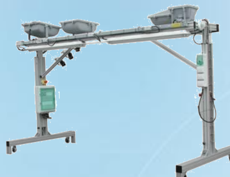
Système d'éclairage et de distribution électrique mobile avec armoire de commande

➤ Cerm éclairage : Eclairagisme & Mise en œuvre de l'énergie réactive sur un TGBT didactique