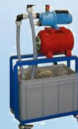
Options Kit éclairage & Surpresseur

➤ Option : Raccordement d'une éolienne 400W pour compléter les activités liées aux énergies renouvelables connecté sur l'armoire du kit photovoltaïque